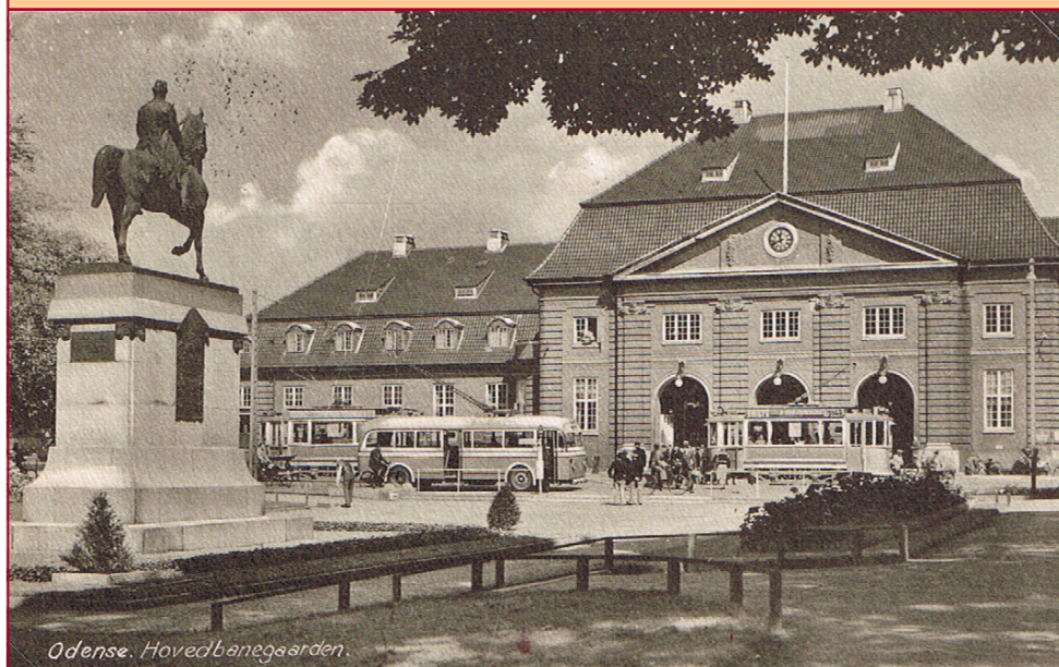
ODENSE BANEGÅRD FRA 1914.