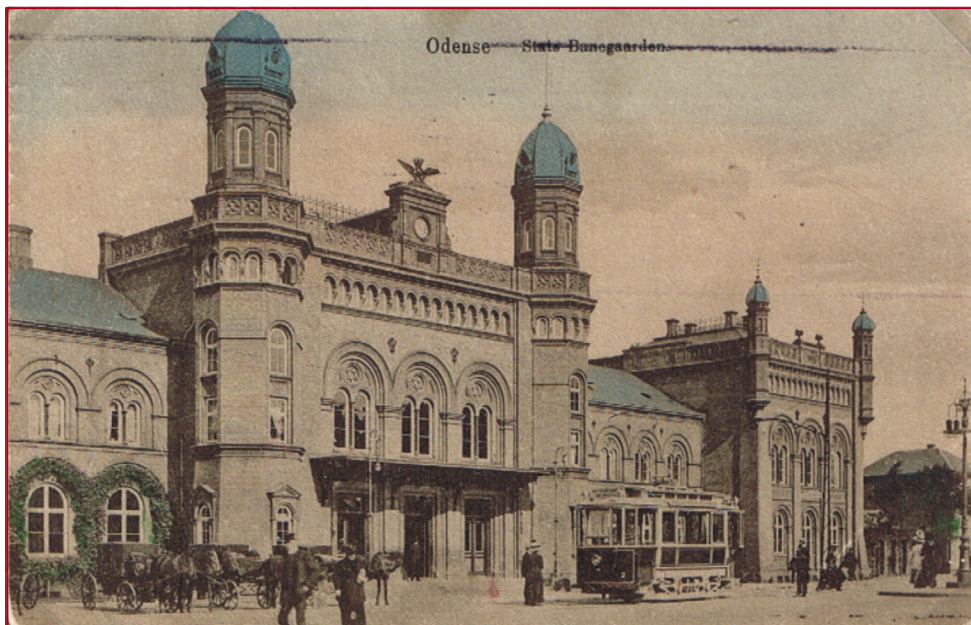
ODENSE BANEGÅRD FRA 1883.