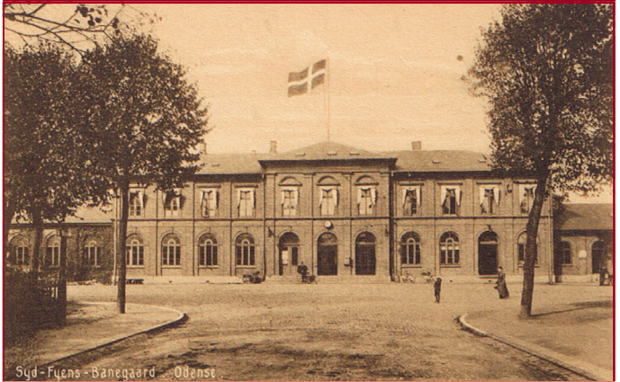
Syd - Fyens - Banegaard - Odense

SYD- FYENS - BANEGÅRD ODENSE OMKRING 1915.