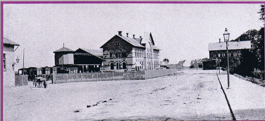
Foto af Odenses første banegård samt det nye posthus overfor jernbanen. Odense havde nu her i 1865 da jernbanen åbnede 2 posthuse, et inde i byens centrum (rådhuset) og det andet her ved jernbanestationen.