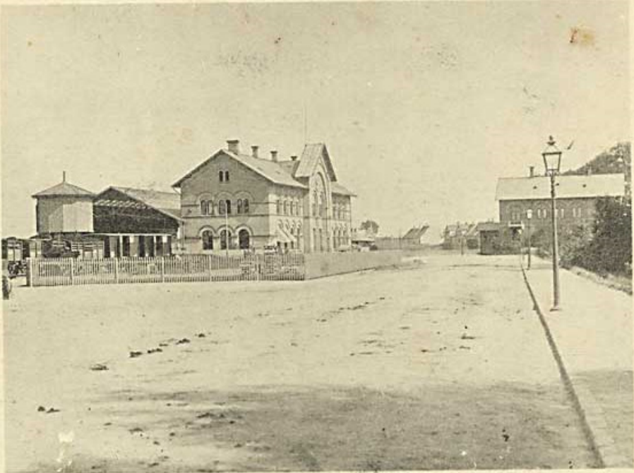
Den gamle Statsbanegaard (tilbage Posthuset).

ODENSE BANEGÅRD OMKRING 1865 - 1914. POSTHUSET TIL HØJRE PÅ KORTET.